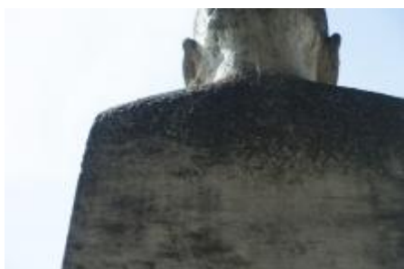
signatura, 9/2019 MČ