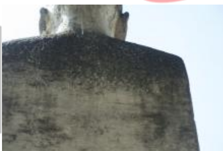
datace, 9/2019 MČ