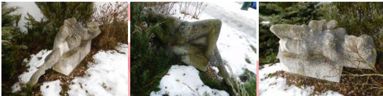
umístění v ul. Na Kopci, umístění v ul. Na Kopci, umístění v ul. Na Kopci, 2017 2017 2017