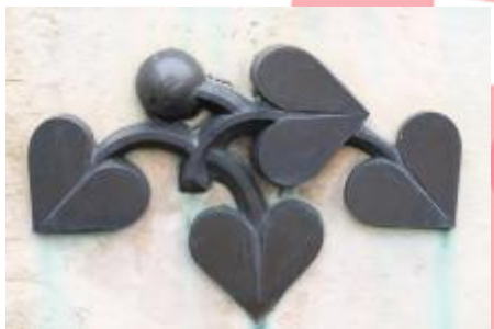
Detail centrálního dekorativního motivu (07/2017 PHe)