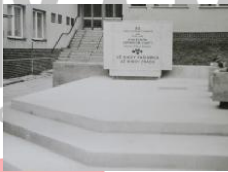
Muzeum umění Olomouc, fond Dílo, karton 8.