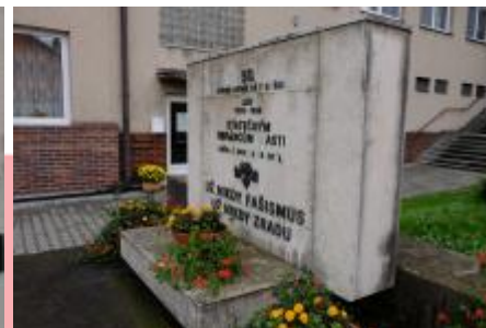
Tříčtvrteční pohled (07/2017 PHe)