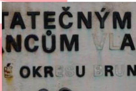
Detail s odpadnými písmenky nápisu (07/2017 PHe)