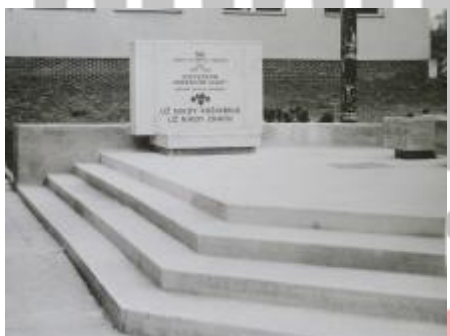
Muzeum umění Olomouc, fond Dílo, karton 8.