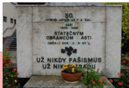
Památník celkový pohled (07/2017 PHe)