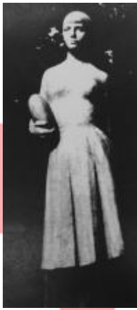
Jan Zejda ed., Lanžhot, Praha 1983, obr. 102; socha Vítání