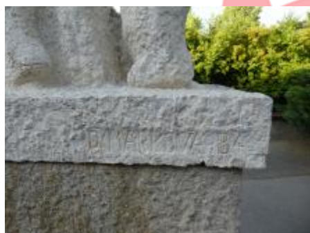
signatura; 6/2017 VŘ