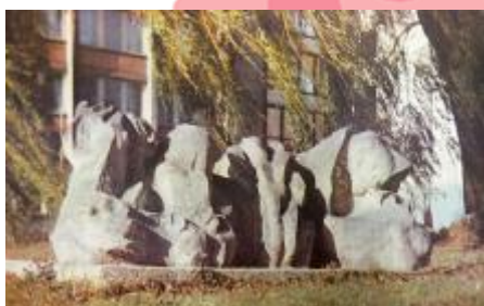
Jbk. Vycházky za výtvarnými díly v našem městě, Miroslav J. Černý, Ústecké přehledy, 1987, č. 9