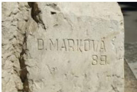
signatura (7/2022 KK)