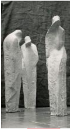
model sousoší, pozůstalost Vladimíra Kýna a Jaroslavy Lukešové v držení syna Zdeňka Lukeše