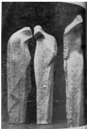
Kýn, model plastiky v Bílovci, Čsk. architekt, 1985, č. 8