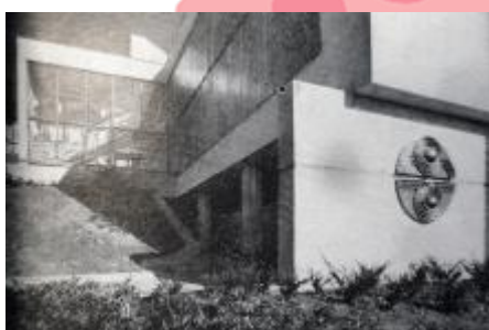
Balneoprovoz Jeseník, Československý architekt XXIX, 1983, č.9, s.3.