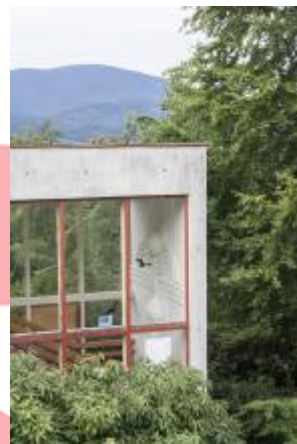
vnitřní reliéf v pohledu zvenčí (06/2016 JI)