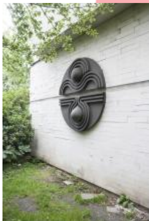
venkovní reliéf (06/2016 JI)