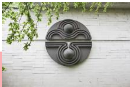
venkovní reliéf (06/2016 JI)