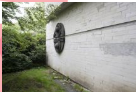
venkovní reliéf (06/2016 JI)