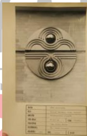
MUO, fond Dílo.