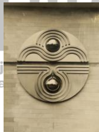
MUO, fond Dílo.