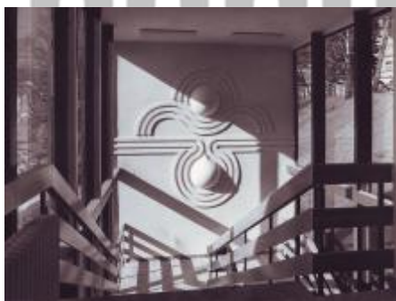
vnitřní reliéf, archiv Petra Sikuly, foto Petr Sikula.