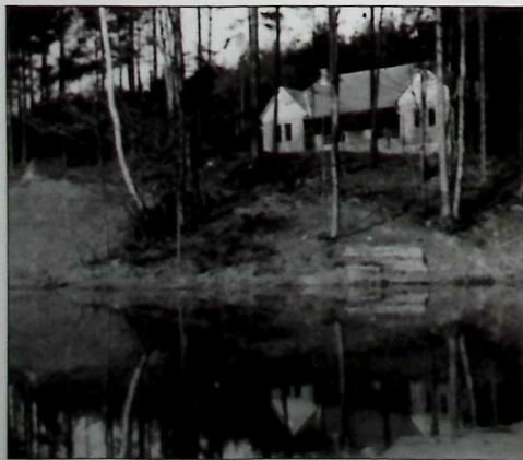
Tábořiště Ježkov po roce 1938