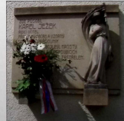
Deska Karla Ježka na Ježkově domě v Doubravici v současnosti