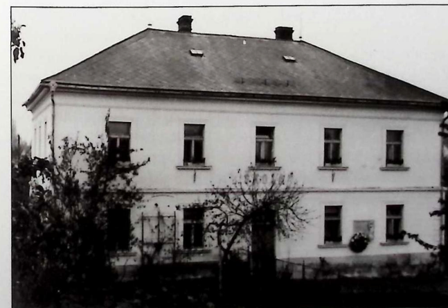
Doubravická škola s pamětní deskou