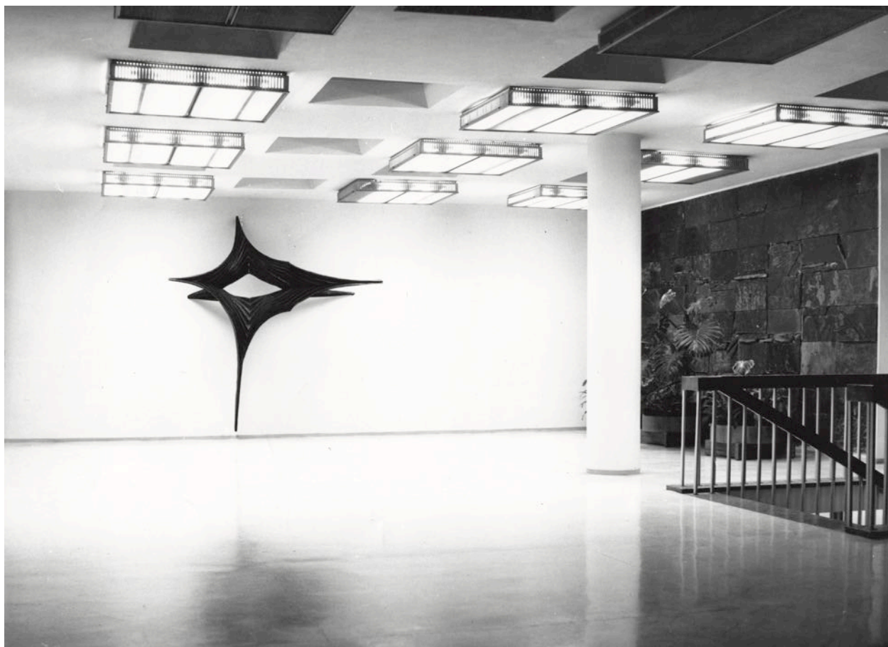
4 – Interiér haly Centropjektu Gottwaldov, 1969.

Zakládání komisí pro spolupráci výtvarníka s architektem navázalo na starší praxi. 42 Dosud není objasněno, zda tyto nejstarší komise fungovaly už od založení ČFVU a podniku Dílo, tedy od roku 1954. Nejstarší nalezené kontinuální zápisy z jednání komisí, vedené od roku 1956, můžeme sledovat v pražské pobočce archivního fondu ČFVU, ze zmínek víme, že schvalování v tomto roce probíhalo i v Ostravě, 43 kde od roku 1955 vhodnost monumentálních zakázek i jejich rozpočty řešil jiný subjekt než ČFVU, a to výbor krajského střediska Svazu československých výtvarných umělců. 44 Stejný orgán schvaloval realizace pro architekturu i v Brně. 45 Zápisy samotné umělecké komise ČFVU v Brně známe až z roku 1961, 46 kontinuálně se zachovaly od roku 1962. Tímto rokem začíná i série zápisů z gottwaldovské (zlínské) 47 a ústecké 48 pobočky, což zřejmě souvisí s uplatněním vyhlášky č. 149/1961, která dala činnosti uměleckých