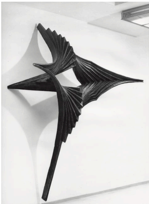
5 – Antonín Gajdušek, plastika v hale Centroprojektu Gottwaldov , 1969.

komisí závazný právní rámec. 49 Zápisové knihy komise pro spolupráci architekta s výtvarníkem se zachovaly pro tuto dobu také v ostravské pobočce. 50