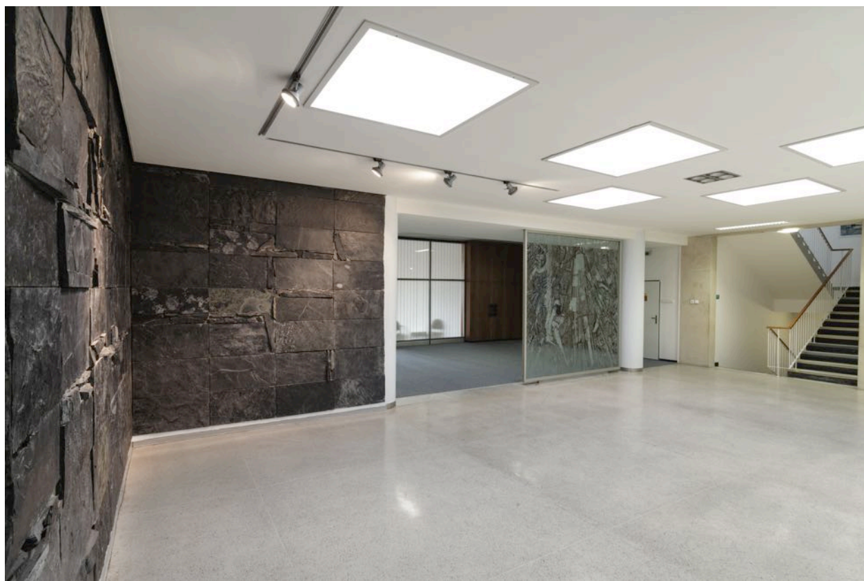
6 – Hala budovy Centroprojektu Zlín, 2016

Téměř veškerý materiál regionálních poboček byl v devadesátých letech 20. století svezem a uskladněn v Praze. V době likvidace podniku Dílo a přechodu ČFVU na Nadaci ČFVU byly archiválie údajně uloženy v několika pražských